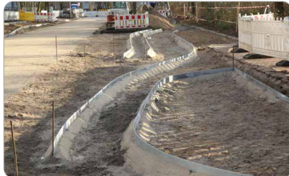
Zunächst werden die Seitenanlagen gebaut. Hier ist schon erkennbar, wie der verkehrsberuhigte Straßenabschnitt künftig geführt wird. Bald schon kann dieser vielfältig genutzt werden.