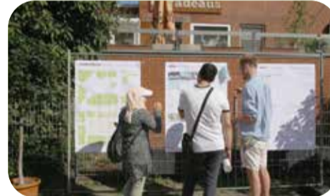
Vergangenen Sommer konnten die Bewohner*innen erleben, wie der Sahlkampmarkt künftig genutzt werden kann. Außerdem hatten sie die Möglichkeit, Ideen einzubringen und ihre Meinung zu äußern.

werden, um sie auch bei schlechtem Wetter nutzen zu können. Der Platz soll künftig möglichst hell ausgeleuchtet sein. Die Interessen der Marktbesucher*innen werden bei der Planung ausreichend beachtet.