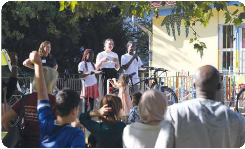
Die Feier zum Weltkindertag startete im NaDiLa mit einer Begrüßung und einem Quiz.