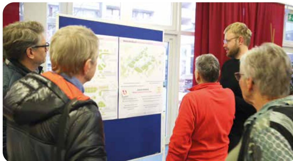
In den Arbeitsgruppen wurde angeregt diskutiert. Dabei halfen ausliegende Pläne. Auch auf Schautafeln im Foyer des Stadtteiltreffs wurden bisherige und geplante Projekte anschaulich dargestellt.