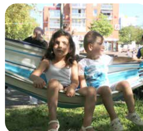
Hängematten luden zum Chillen ein.

Bis Ende dieses Jahres soll die endgültige Abstimmung darüber erfolgen, wie der Sahlkampmarkt und die angrenzenden Straßen gestaltet werden. Dann wird eine konkrete Entwurfsplanung vorliegen. Die Bauarbeiten sind für kommendes Jahr geplant.