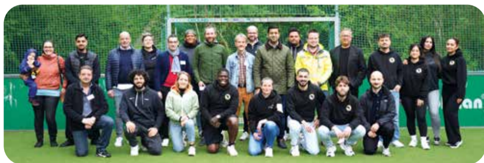
Das ASV-Team treibt nicht nur selbst Sport, sondern engagiert sich auch für soziale Projekte.

Der Afrikanische Sportverein Hannover (ASV) ist ein Fußballverein, der sich für Integration, Zusammenhalt und sportliche Förderung einsetzt. Gegründet wurde er vor fünf Jahren. Seither verfolgt der ASV das Ziel, Menschen unterschiedlicher Herkunft über den Sport zusammenzubringen. Die 1. Herren (Fußballsparte) ist in der Kreisklasse aktiv und fördert den Jugend- und Breitensport.