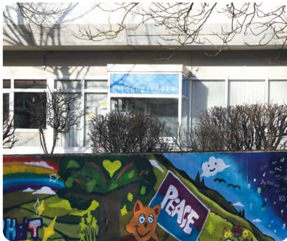
Die Tür des Bildungsladens steht für Hilfesuchende an fünf Tagen in der Woche offen.

Der Bildungsladen hat montags bis donnerstags jeweils von 8 bis 18 Uhr geöffnet. Freitags sind die Öffnungszeiten von 10 bis 14 Uhr. Nach Absprache sind auch außerhalb dieser Zeiten Beratungen möglich. Telefonisch ist der Bildungsladen unter der Rufnummer (0511) 92001317 erreichbar. Die Mailanschrift lautet bildungsladen@pro-beruf.de. Weitere Informationen finden sich auf der Website www.pro-beruf.de .