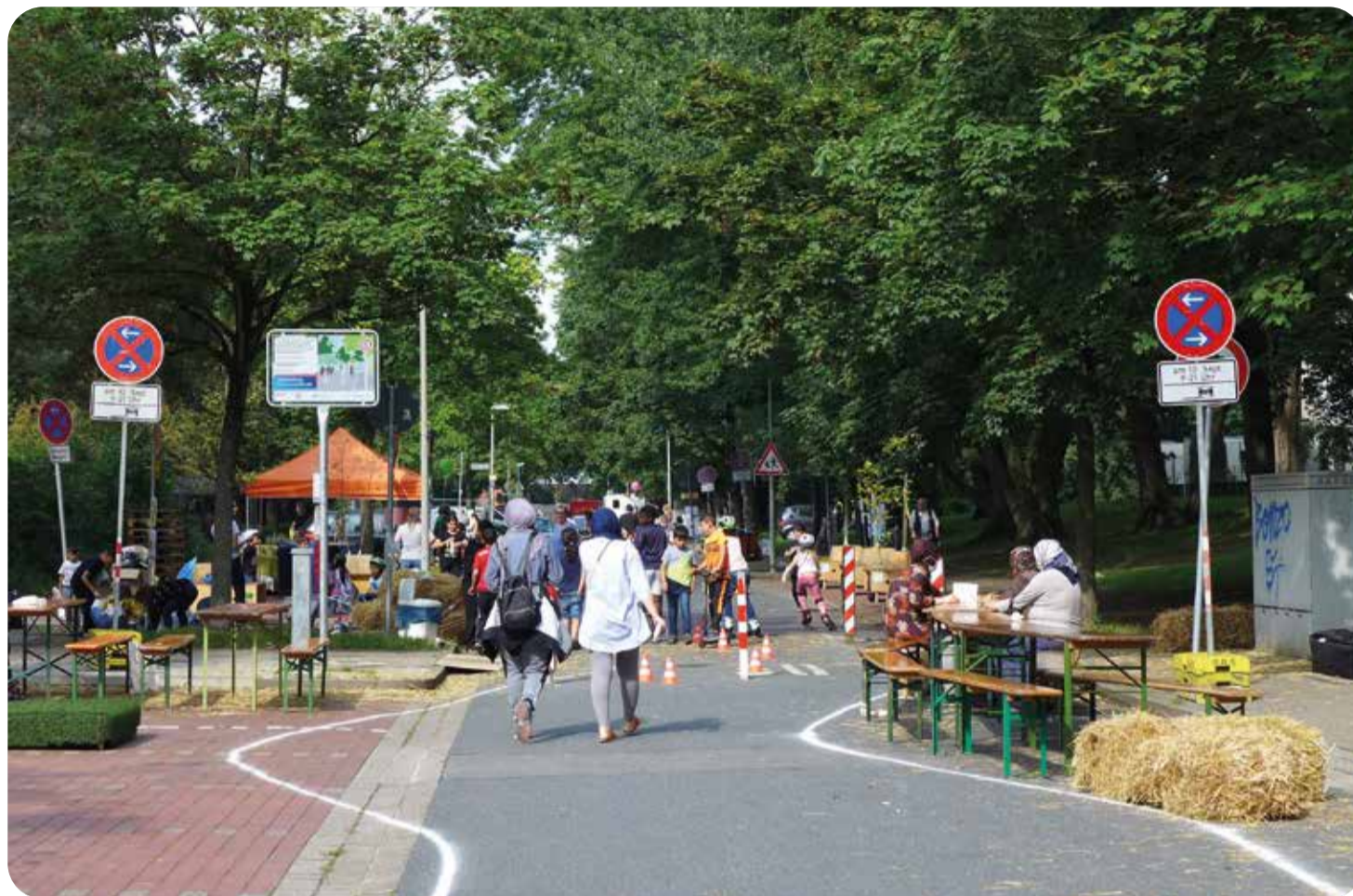
Geschwungene Linien, Sitzgelegenheiten und Spielmöglichkeiten: Bei einem Freiraumversuch vor einigen Jahren wurde für einen Tag erlebbar, wie die Schwarzwaldstraße schon in wenigen Wochen auf einem Teilstück dauerhaft aussehen wird und genutzt werden kann.

Ein Planungsbüro hatte an dem Aktionstag zwei Entwürfe präsentiert: Das sogenannte „Wechselspiel“ sieht verschiedene Querungen vor, die in Zickzacklinien über die Straße verlau-