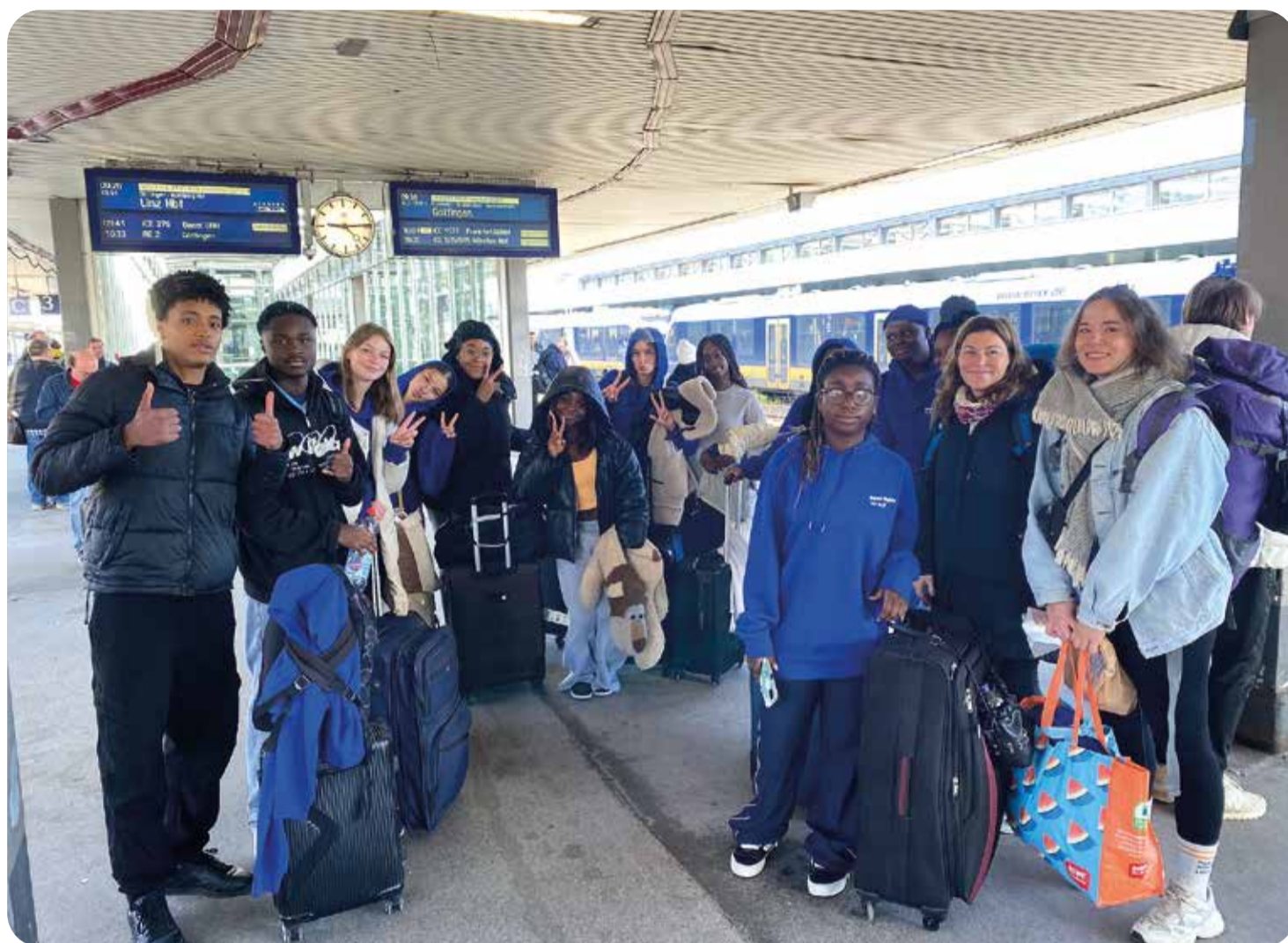
Wenn einer eine Reise tut, hat er etwas zu erzählen: Diese Gruppe Jugendlicher brach vergangenes Jahr nach Wien auf und erlebte dort eine tolle Zeit.

Nachdem das Projekt nun abgeschlossen ist, können wir sagen, dass es uns sehr gefallen hat, weil wir sehr viel gesehen und gelernt haben. Wir haben neue Bekanntschaften gemacht und andere Seiten von Europa erlebt. Wir denken, dass wir beiden Autorinnen für alle aus dem