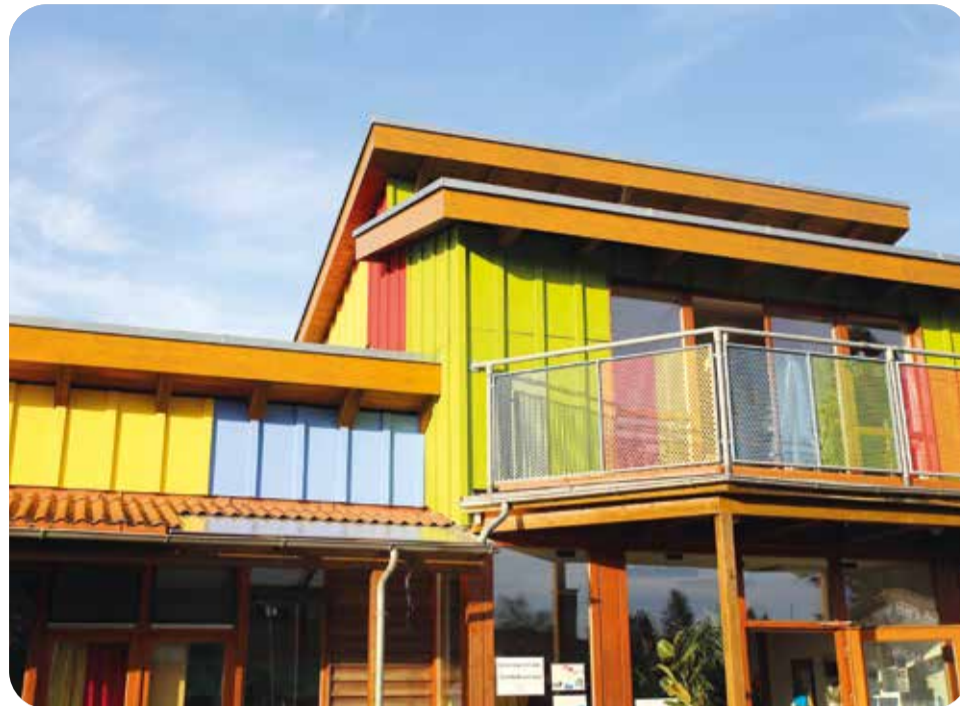
Leuchtende Fassaden: Im Sonnenlicht kommt der Farbanstrich besonders gut zur Geltung.

Wichtiges Anliegen beim Umbau ist die Barrierefreiheit: Das Gelände und die Gebäude werden künftig mit dem Rollstuhl zu erreichen sein. Die nachhaltige Energieversorgung spielt ebenfalls eine große Rolle. Deshalb werden eine Wärmepumpe und eine Photovoltaikanlage