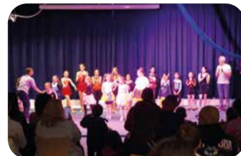
Gesicht zeigen: Kinder und Erwachsene aus Deutschkursen gestalteten die Litfaßsäule vor dem Stadtteiltreff. Das Fest anlässlich des 25-jährigen Jubiläums der Stadtteilkultur war gut besucht. Auch der Kinderzirkus Sahlino zog bei seinem Auftritt viele Besucher*innen an.

richtungen aus dem Sahlkamp. Sie leisten im Stadtteil wichtige Beiträge für die soziale, kulturelle und räumliche Entwicklung. Das 25-jährige Jubiläum sei zum Anlass genommen worden, auf die wertvolle Netzwerkarbeit zwischen den vielen sozialen und kulturellen Einrichtungen aufmerksam zu machen, erklärt Susanne Konietzny: „Diese Zusammenarbeit besteht bereits seit Jahrzehnten. Regelmäßig treffen wir